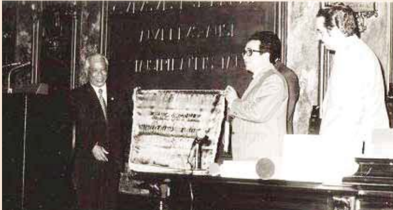
> Trao tặng kỷ niệm cho Hiệu trưởng Trường ĐH Tổng hợp La Havana năm 1978